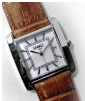
マザーオブパール ボーイズ シルバーケース ブラウンベルト HAKU-MK17-406-SV-BW