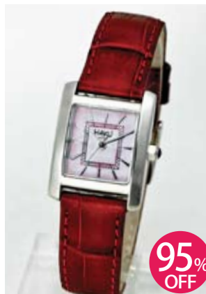
マザーオブパール レディース シルバーケース レッドベルト HAKU-MK17-405-SV-RD