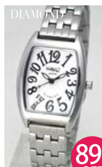
プリンセスダイヤモンド レディース ホワイト文字盤 HAKU-MS03L-WH