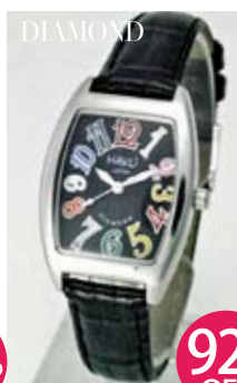
プリンセスダイヤモンド レディース 本革ベルト/マルチ カラー/ブラック文字盤 HAKU-MS03L-LE-ML-BK