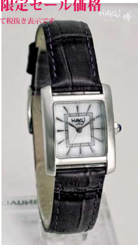
マザーオブパール レディース シルバーケース パープルベルト HAKU-MK17-405-SV-PUR