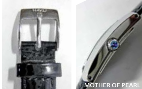
MOTHER OF PEARL