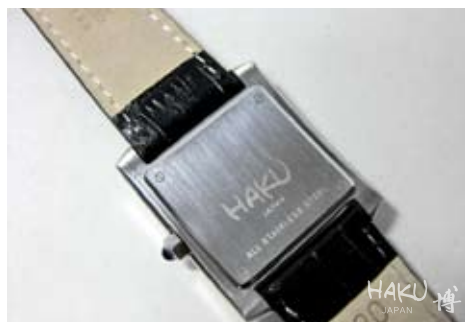
The belt is Genuine Leather and the stainless steel case

堅牢なステンレス製のケースは優れた密封性を発揮し、衝撃や水分から本体内部の機械を守ってくれます。また生活防水型の品質表示であっても、当社製品は耐蝕・耐水性にとっても優れておりますので安心してお使いいただけます。