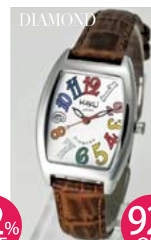
プリンセスダイヤモンド レディース 本革ベルト/マルチ カラー/ホワイト文字盤 HAKU-MS03L-LE-ML-WH